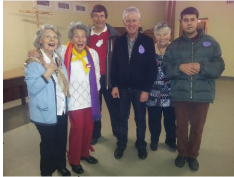
Une partie de l'équipe d'organisation.